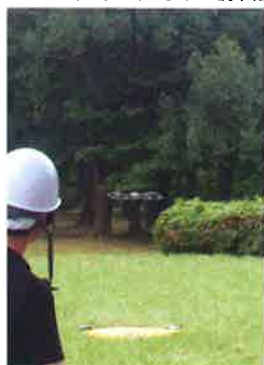
イメージ (2019年8月撮影)

プロ仕様のドローンで操縦体験・訓練を複数回実施します。離陸や水平移動、上昇・下降などの操作を体験します。最後に、フィールド内で操縦しながら動画を撮影します！