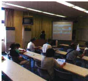
イメージ (2019年8月撮影)

はじめに、ドローンの仕組み、産業別の活用事例や将来性等の講話と、屋外飛行時の守るべき法令、操縦時の注意点等を講師から学びます。