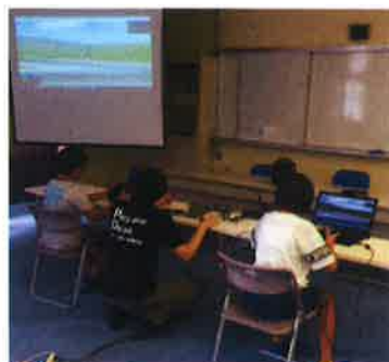
イメージ (2019年8月撮影)

パソコンを使用して画面内でドローンを操縦します。実物と同じタイプのコントローラを使い離陸・移動・着陸等の操縦感覚をつかみます。