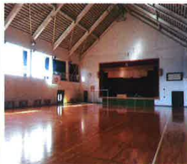
体育館内イメージ (2019年撮影)

雨や風が強い場合会場から車で移動して、あざいカルチャー&スポーツの体育館・研修室にてツアーを実施します。