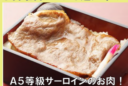
A5等級サーロインのお肉！

千乃房 近江牛肉の薄焼きステーキ重(イメージ) ※このほか前菜・デザートなどがつきます。