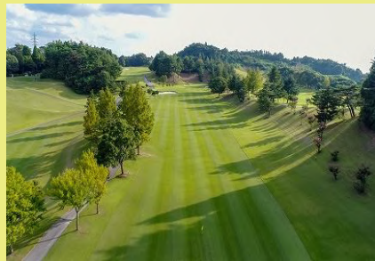
彦根カントリー倶楽部（イメージ）