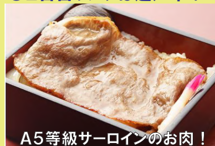
A5等級サーロインのお肉！

千の房 近江牛肉の薄焼きステーキ重（イメージ） ※このほか前菜・デザートがつきます。