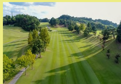
彦根カントリー倶楽部(イメージ)

千乃房 近江牛肉の薄焼きステーキ重(イメージ) ※このほか前菜・デザートなどがつきます。