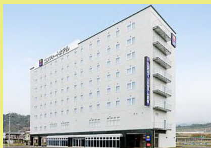
宿泊先：彦根コンフォートホテル （シングルルーム・朝食付き）