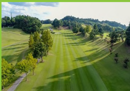
彦根カントリー倶楽部 (イメージ)