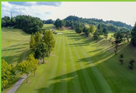
彦根カントリー倶楽部 (イメージ)