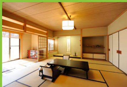
宿泊先: 料亭旅館やす井 (新館 4名1室利用夕・朝食付)