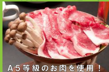
A 5等級のお肉を使用!