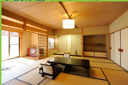
宿泊先: 料亭旅館やす井 (新館 4名1室利用夕・朝食付)