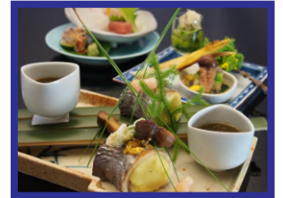
やす井 食事（イメージ）

明治2年創業の老舗旅館。和室の客室から庭園を望むことができ、ごゆっくりお寛ぎいただくことができます。また、檜風呂で一日の疲れを癒してください。