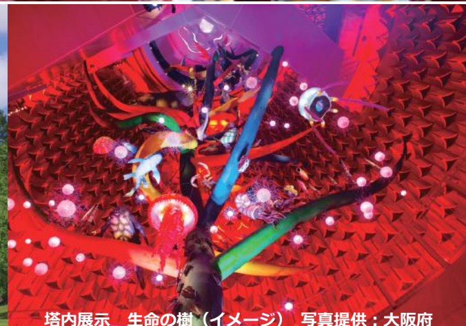
塔内展示 生命の樹（イメージ）