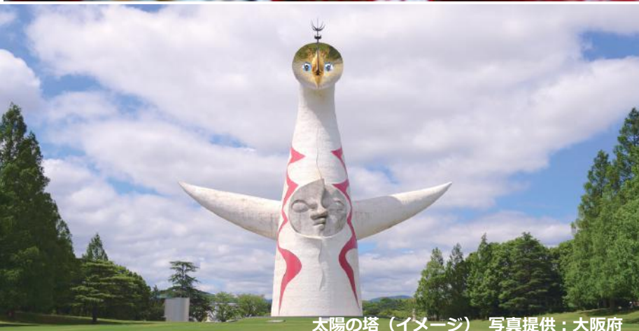
太陽の塔（イメージ）