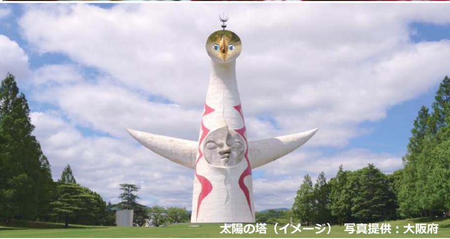
太陽の塔 (イメージ)