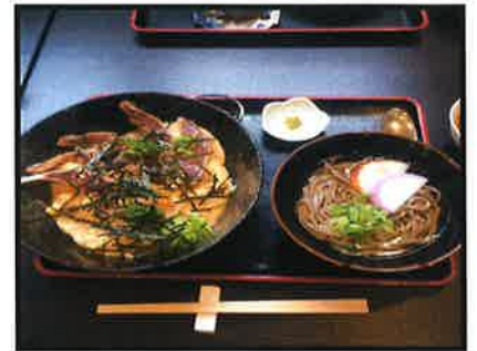
写真④ 昼食 (※4 枚ともイメージです)