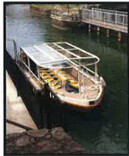
写真② びわ湖疏水船