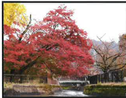
写真③ 四宮付近の景観