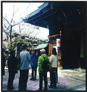
写真① 大津市内のまちあるき