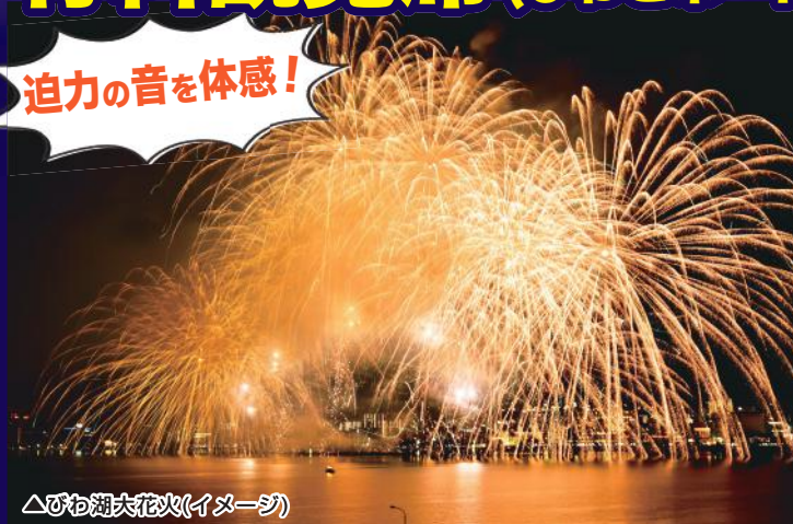
△びわ湖大花火(イメージ)