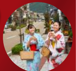
△ゆげ街道まち歩き(イメージ)