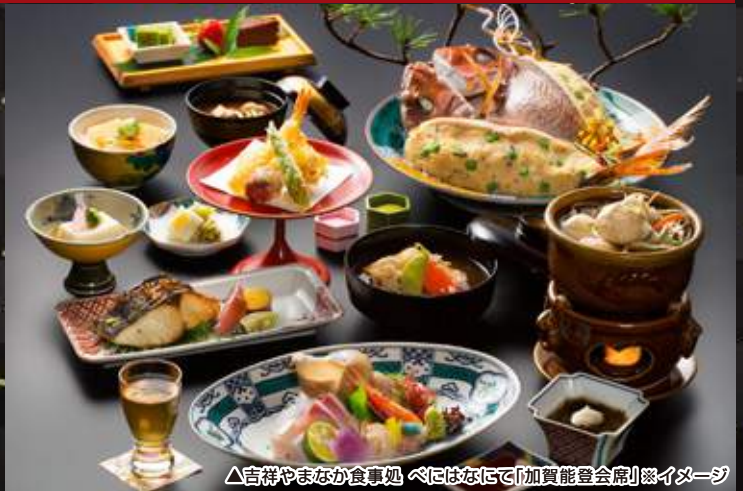
△吉祥やまなか食事処 べにはなにて「加賀能登会席」イメージ