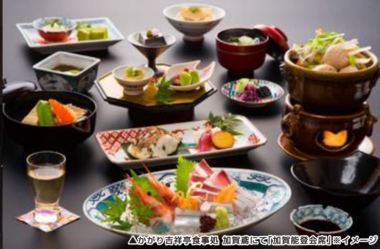
△かがり吉祥亭食事処 加賀鷹にて「加賀能登会席」イメージ