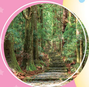
熊野古道イメージ (中辺路 大門坂)(XM)