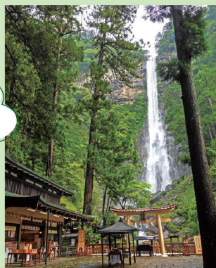
イメージ

那智大滝は、落差133m、落ち口の幅13m、日本三名瀑に数えられています。飛瀧神社には神様をお祀りする社はなく、御瀧そのものを御神体としてお祀りしています。(御瀧拝所舞台へはご案内しません。)