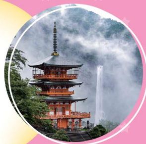
那智大滝と三重の塔