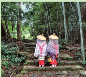
イメージ(中辺路 大門坂) (AK)

平安の古より都をはじめ各地から多くの人々が訪れたこの地は、世界でも類を見ない文化的景観として、2004年7月に世界文化遺産に登録されました。当ツアーでは緑深い杉木立と苔むした石段に囲まれた大門坂のミニウォーキングにご案内します。 ※駐車場から大門坂入口までの時間を含みます。(歩きやすい靴でご参加ください。)