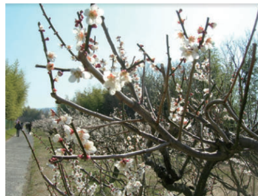
青谷梅林（イメージ）