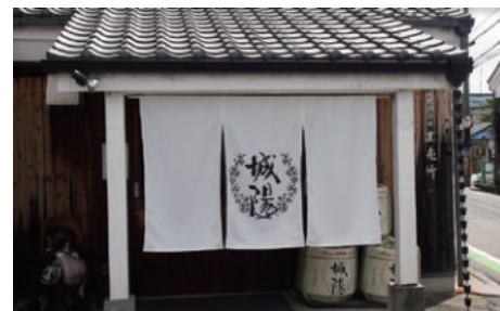
城陽酒造（イメージ）