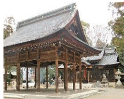
乎加神社（イメージ）