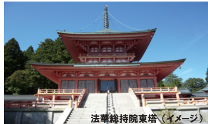
法華総持院東塔（イメージ）