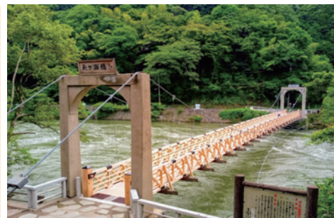
天ヶ瀬つり橋（イメージ）