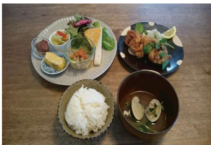
やまぼうし/おまかせごはん