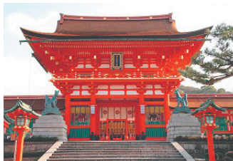
伏見稲荷大社 楼門