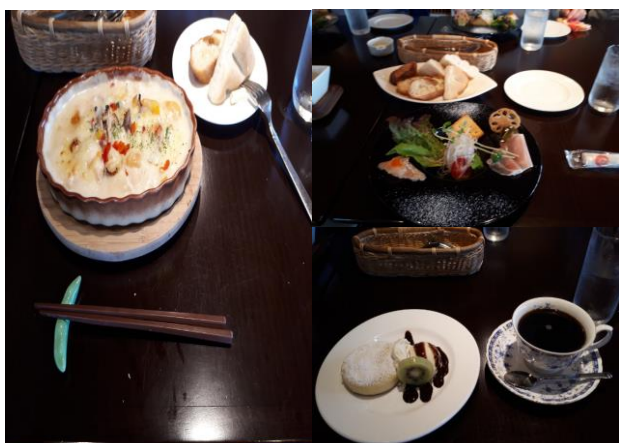
ペコリーノ グラタンランチの昼食 前菜・デザートも付いて見た目も味も大満足。