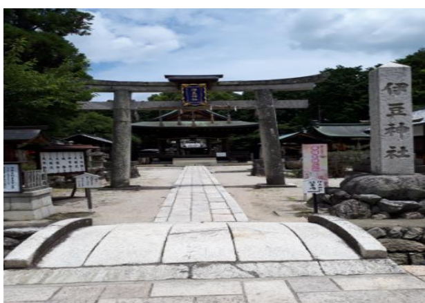
京都、下鴨神社の御厨になっている伊豆神社。 現在も葵祭には琵琶湖の鮎を奉納しています。