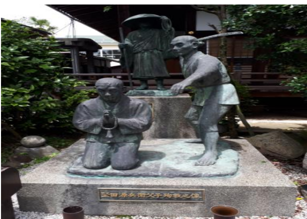
光徳寺境内の堅田源兵衛親子殉教の像 蓮如上人の為に首を差し出した物語に感動。