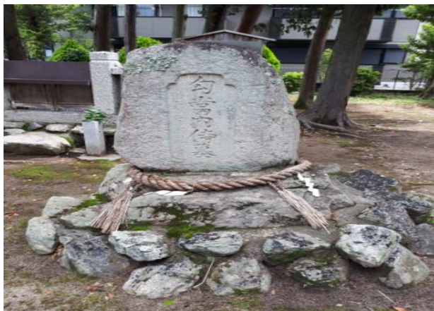
野上神社 勾当内侍の石塚 新田義貞の訃報を聞き湖に身投げした内侍のお墓

予定になかった見どころも案内して頂き、もりだくさんのじんもとりっぷになりました。ご参加頂いたお客様、ありがとうございました。